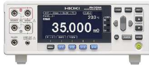
RESISTANCE METER RM3544

Medidores de resistencia para calcular el largo de cable, el estado de conductores delicados como los presentes en los robots.