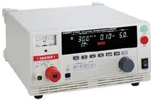
INSULATION / WITHSTANDING HiTESTER 3159-02