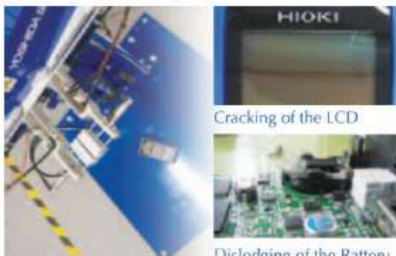
Cracking of the LCD